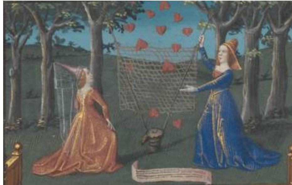
Le livre du Coeur d'amour épris, par le roi René d'Anjou. 1401-1500